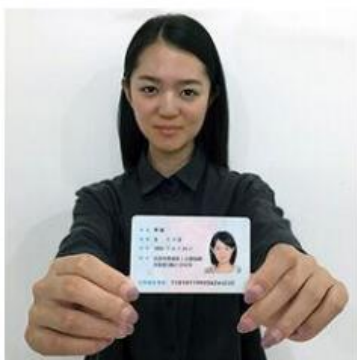
手持身份证照片示例