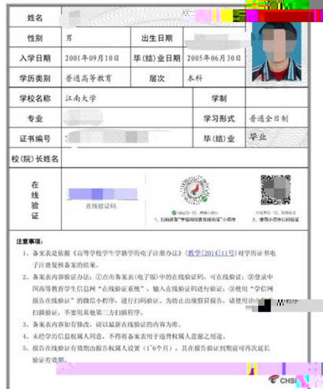
教育部学历证书电子注册备案表照片示例