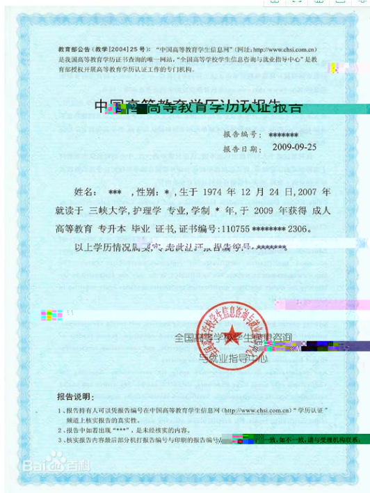
教育部学历认证报告照片示例