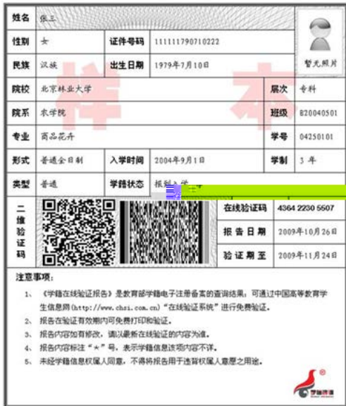
教育部学籍在线验证报告照片示例