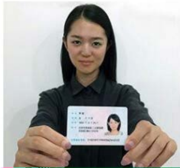
手持身份证照片示例