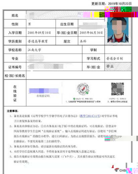
教育部学历证书电子注册备案表照片示例