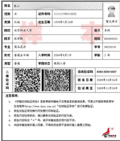
教育部学籍在线验证报告照片示例