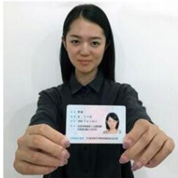
手持身份证照片示例